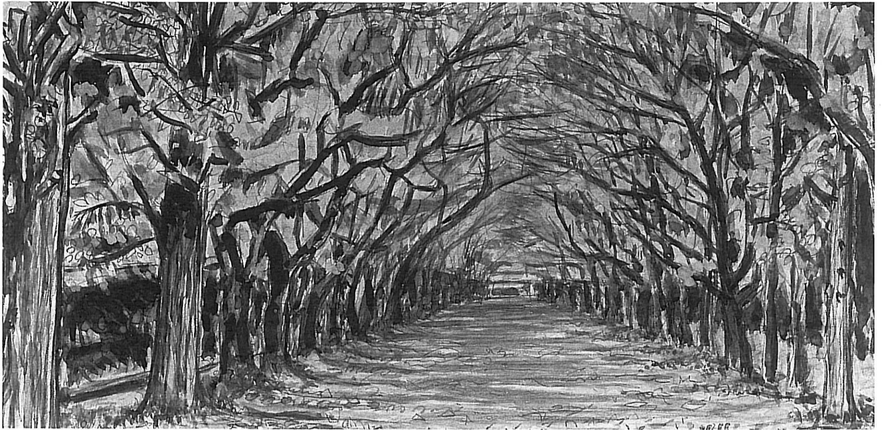
中央道並木道 水彩画・内藤修次 (八期工卒)