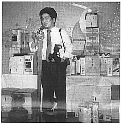
私はカメラマンの渡井です

五月に入り雨ばかりの毎日、わずかに三日間続いた好天の三日目、平成七年五月二十日、総会は会場の都合等もあつて土曜日に開催された。