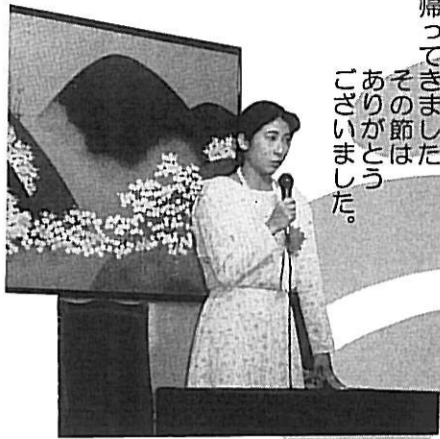
帰ってきました その節は ありがとうございました。 ございました。