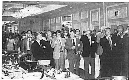
さあ 楽しい懇親会が始まるぞ