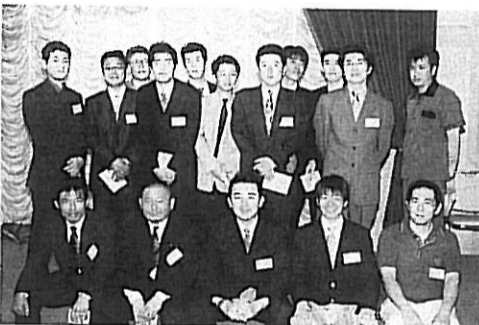
僕達20代の卒業生だよ