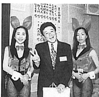
毎年同窓会に来なくちゃ損だよ!!