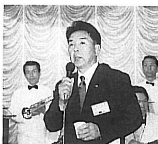
“北高の隆盛を願って乾杯”