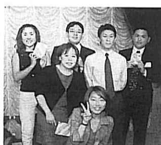
若い人達がもう少し来て頂だい