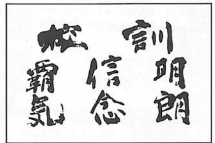
後藤英鵬 書 (県三)