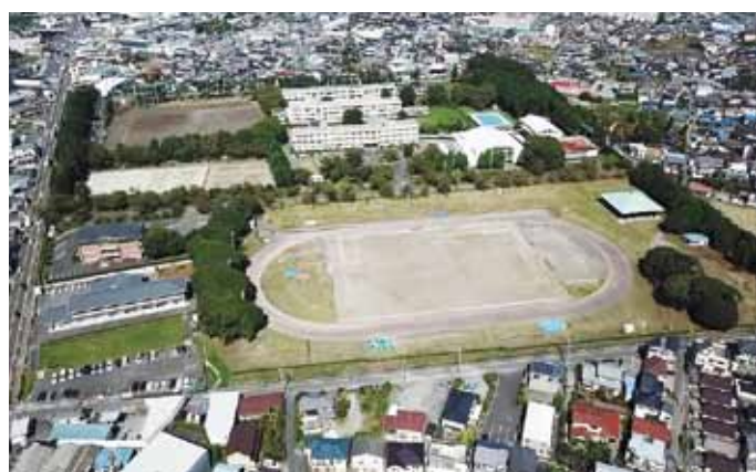
平成 29年 8月 北高上空より

記念事業、卒業記念品、部活動支援としてエアコン設置のための積立金に活用できました。「終身会費」と「北高未来応援金」に協力していただけるよう活動していきたく考えています。今年度は二百四十六名の生徒が入学しました。新入生がそして、二年生・三年生が安心して高校生活を送ることができるよう北嶺会は支援していきます。会員の皆様、今年度もどうぞよろしくお願い致します。